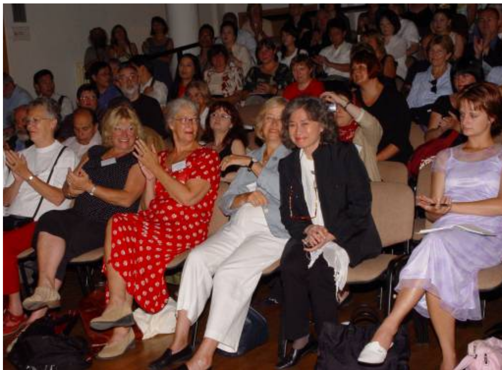
Medzinárodná tlačová konferencia BIB 2005