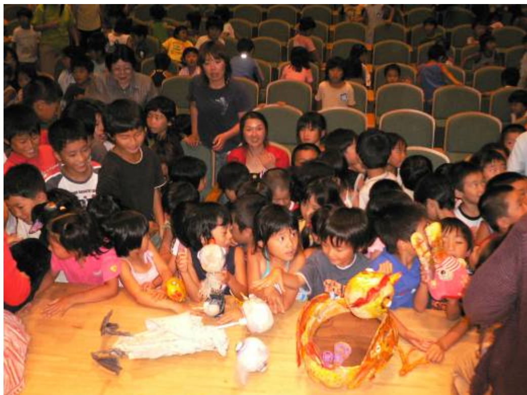
Festivalové predstavenie O škaredom káčatku v Japonskom meste Kumamoto.

BIBIANA zastupovala so svojím pôvodným predstavením O škaredom káčatku ako jediná slovenské divadlo pre deti a mládež v Japonsku na PUTOVNOM FESTIVALE DIVADIEL 18 KRAJÍN EURÓPSKEJ ÚNIE - EUTAC 2005. Predstavenie bolo prezentované veľmi úspešne v štyroch japonských mestách – Tokio, Tottori, Okinawa, Kumamoto a všade sa stretlo s veľkým záujmom detských divákov i odbornej verejnosti. Naše predstavenie tiež dokázalo, že dobré divadlo nepotrebuje tlmočníka. Ocenenia sa objavili aj v japonských médiách. Veľký záujem u verejnosti i odborníkov bol aj o propagačné materiály BIBIANY, pretože jej široko zameraná činnosť zaoberajúca sa profesionálnym umením má v Japonsku dobré meno.