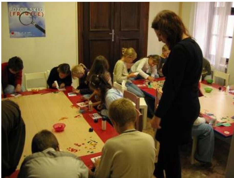
Tvorivé dielne k výstave Pozor sklo! pod názvom Sklíčka.

Podľa ohlasov v tlači aj zápisov v knihe návštev sa zámer podaril. Pred sklom sa sklonili všetci tvorcovia a väčšina návštevníkov. Výstavu videlo 14 255 návštevníkov.